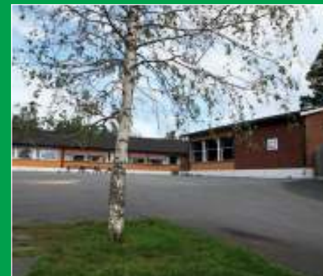
Grendeskolen skal bevares og styrkes