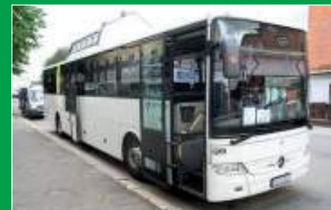
Kollektivtilbudet må styrkes betydelig i Indre Østfold