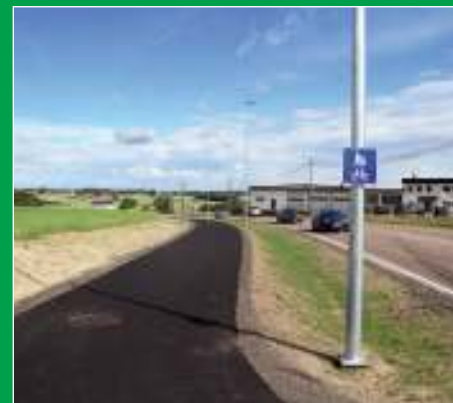
Gang- og sykkelveier må reguleres og bygges